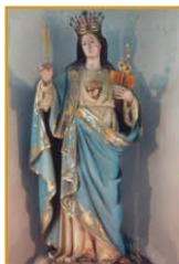
Santa Maria della Provvidenza