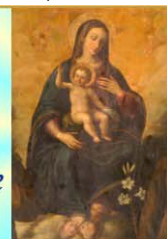
Santa Maria della Salute